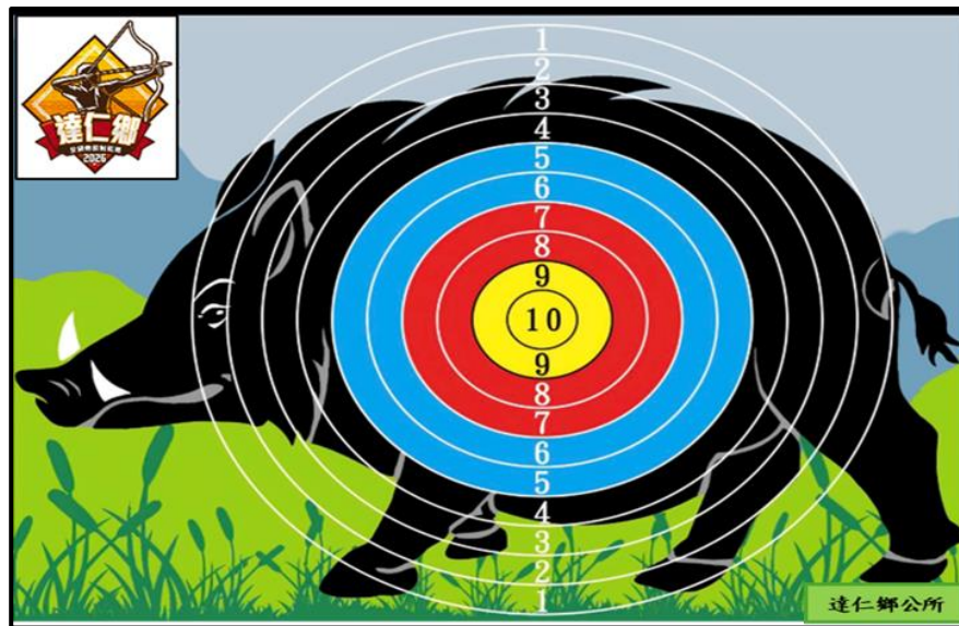
活動流程表(暫定)日期:115年06月19日(星期五)