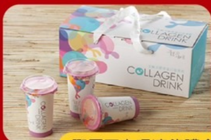
膠原蛋白吸凍飲禮盒