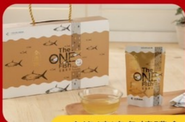
全魚淬滴魚精禮盒