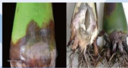
圖3、檳榔根腐病、莖腐病病徵

是一種土壤傳播的病原菌。溫度20~25°C，相對濕度90%以上之環境適合發病，尤其連續降雨(梅雨)或颱風侵襲後又通風不良之園區發病嚴重。