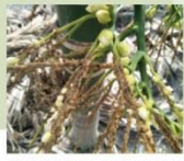
圖5、椰子織蛾危害狀。

檳榔花苞形成初期，成蟲於花穗處產卵，幼蟲由苞葉開口鑽入危害，開花時期花穗串遭幼蟲危害，造成花穗乾枯，影響開花結果，嚴重時導致落果(圖5)。