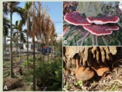
圖4、基腐病(靈芝病)病徵。植株枯死(A)；莖基部產生靈芝子實體(B、C)。