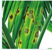
圖2、圓斑病病徵(摘自網路 http://www.ducyuanbi.com/m/view.php?id=146 )

病害全年均會發生，以高溫雨季為好發期。本病原菌和炭疽病菌一樣，主要藉由雨水傳播，感染的部位包括葉片、花、果穗及果實，易造成落果(圖2)。